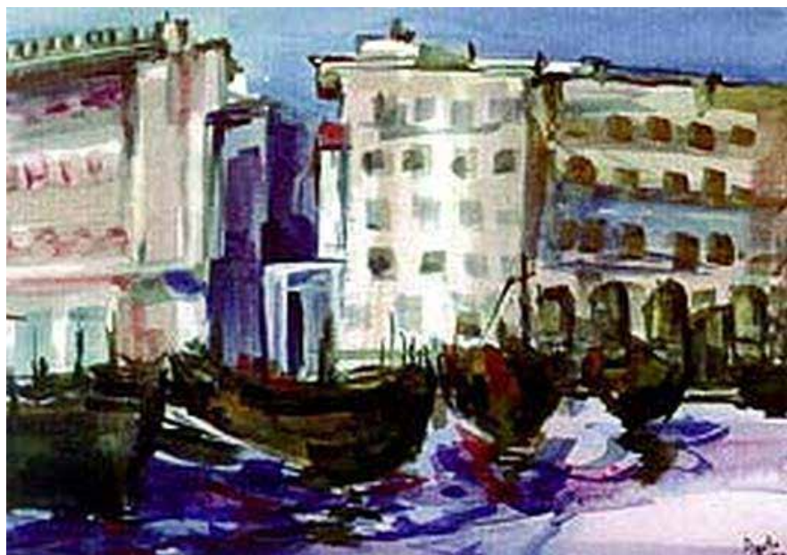
Ágota Mandelot festménye